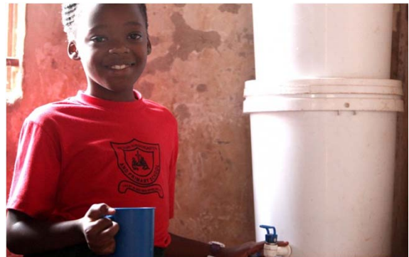
Sauberes Trinkwasser durch Filtersysteme, Uganda