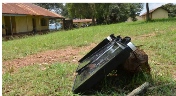
Sauberes Trinkwasser durch Filtersysteme, Uganda